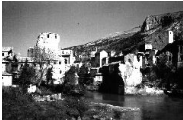
Mostar: Novembre 1993 (il ponte è stato distrutto il 9-11-93)