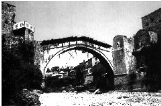
Mostar: Agosto 1993

Nel 1992 con un collega spagnolo riuscimmo ad entrare in Bosnia, accreditati dal contingente ONU. A Sarajevo i “Caschi Blu”, la maggior parte provenienti dalla Legione Straniera Francese, avevano solo il compito di osservatori, e infatti osservavano solo la strage di persone inermi che quotidianamente i cecchini uccidevano. Dopo 20 giorni ci siamo spostati a