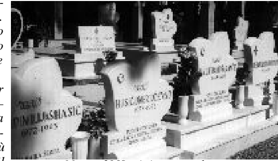
Mostar 2009: cimitero musulmano

tanto che avverti qualcosa che, come un fuoco latente, è pronto a riaccendersi e divampare. La corrente del fiume Neretva lambisce di nuovo i pilastri del ponte, ma il rumore dell'acqua porta strane sensazioni di grande tristezza. Sono ritornati a funzionare i negozi artigiani a ridosso del ponte, frequentati dai turisti, però nessuno vuol parlare di quel tragico periodo. Molte case riparate dai danni causati dalla guerra sono state dipinte di rosso, giallo e rosa e sui davanzali delle finestre fanno bella mostra magnifici fiori. In bella evidenza due ristoranti con menù italiani: spaghetti e pizza. Mi hanno riferito che i pasti erano ottimi. Ai piedi dell'arco di ponente del ricostruito ponte c'è una pietra scheggiata da una granata, sulla facciata è visibile