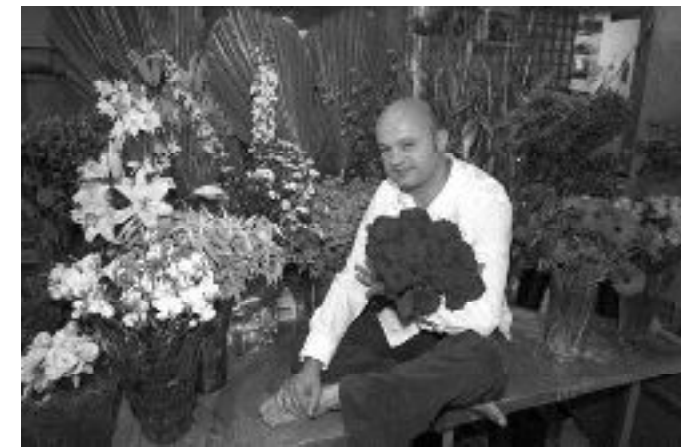
Ercole "immerso" fra i fiori

Credo che questo sia il momento giusto, come ho già fatto in altre